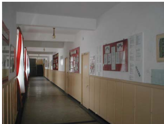
aspect din interiorul școlii