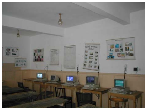
laborator de informatică